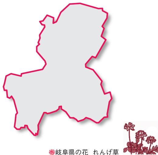
岐阜県の花 れんげ草