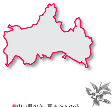
山口県の花 夏みかんの花