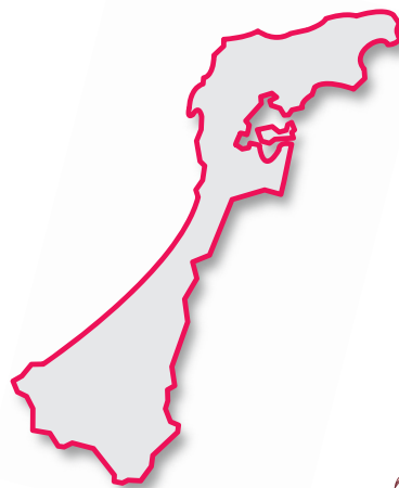
石川県の花 クロユリ