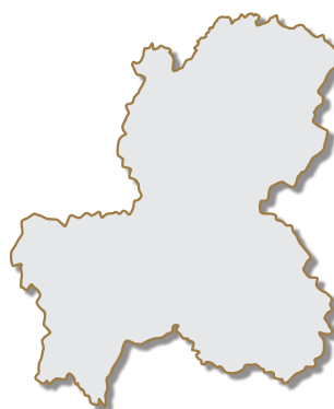
● 岐阜県の花 れんげ草（げんげ）