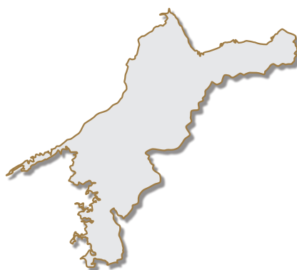
● 愛媛県の花 みかんの花