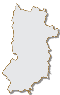
● 奈良県の花 奈良八重桜