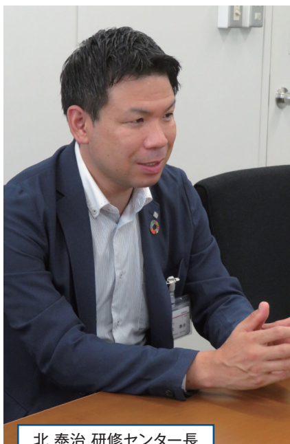
北 泰治 研修センター長 ※ 2021年9月30日現在

（評価の厳しい・甘い上司に差異がある）、②はマーケットに左右されることによって、公平公正な判断が下されない可能性があります。③の勉強は目に見えるもの（努力の証そのもの）です。この意味で検定試験は、客観的な判断としては最適と考えています。それだけ勉強する文化を大事にしているのです。